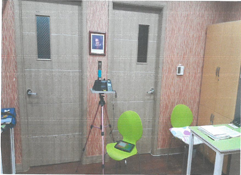
B1F - 피아노실